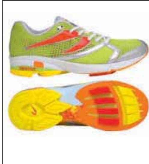
10 Newton Laufschuh. Vier rote Blöcke unterhalb der Mittelfußköpfchen liegen federnd auf einer Membran.

das Element – je nach Profil – in die laterale Bewegungsrichtung (Pronation/Supination) wie eine starke oder schwache Stoßstange. Verschiedene Plattenkonstruktionen geben so den unterschiedlichsten Schuhmodellen ihre spezifischen Bewegungs- und Trageigenschaften. Die „Wave“-Platte macht somit den Einsatz von nur einer Schaumdichte im EVA-Zwischensohlenmaterial möglich. Klarer Vorteil dieser Konstruktion ist die extrem leichte und gleichzeitig flache Bauweise des Schuhs.