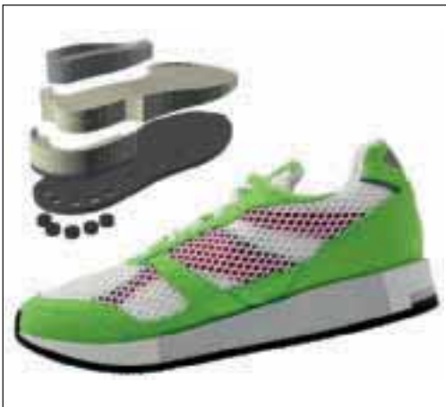
8 Lunge – klassische Bauweisen aus den 80er-Jahren. Die Lösung?

Flaggschiff und erwähnenswerte Technologie ist die selbstgetaufte „Wave“-Platte, die in allen Laufschuhen verbaut wird. Gegenüber dem Einsatz von viskösen, gelartigen Flüssigkeiten oder anderen Kammerdämpfungssystemen bei anderen Herstellern ist das Besondere an dieser Konstruktion, die bei der Landung auftretenden Scherkräfte in eine Dämpfung und laterale Stabilität zu transformieren. Das Element wirkt in der frontalen Bewegungsrichtung wie ein Stoßdämpfer, da die Wellenform in Laufrichtung extrem flexibel bleibt. Gleichzeitig wirkt