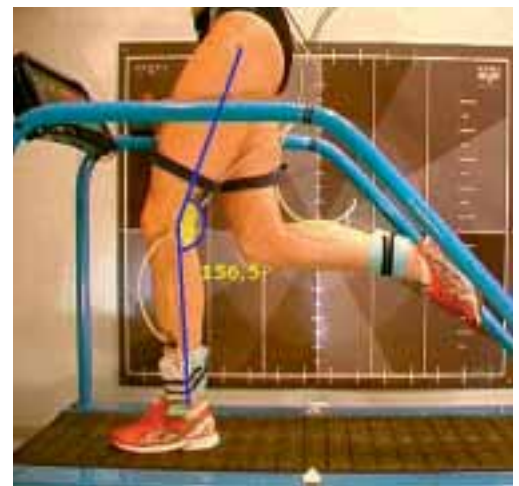
3 Aktiver Laufstil: Aufsetzen mit dem Mittelfuß bei gebeugtem Knie dicht vor dem Körperschwerpunkt.

Sprunggelenk. Als Ausgleich reagiert die menschliche Muskulatur mit muskulären Dysbalancen zwischen der Streck- und Beugeschlinge und einer vermehrten Knieflexion im Gang. Gut zu beobachten ist dies im sagittalen Gangbild bei Frauen, die hohe Absätze tragen. Die Strecksehne wird kräftiger („verkürzt“), während die Beugeschlinge abschwächt.