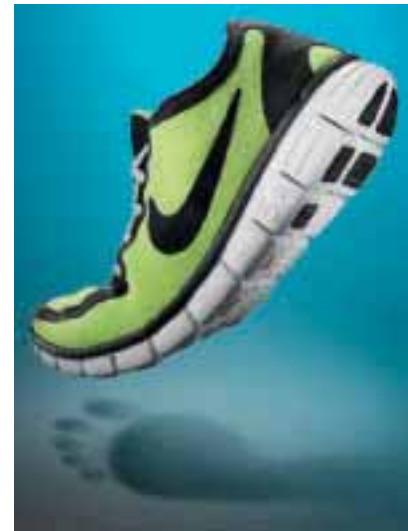
6 Tiefe Flexkerben mit einem Drehpunkt dicht unterhalb der Fußsohle zeichnen den Free aus.

Der Nike Free (Markteinführung 2005) kommt genau diesen Anforderungen entgegen, indem er die Vorteile des Barfußlaufens mit den Schutz-