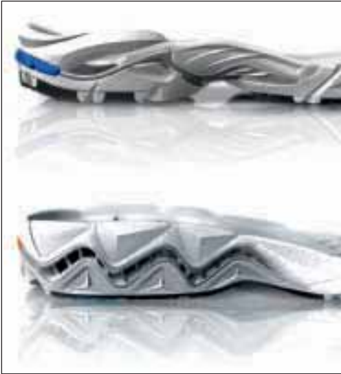
9 Mizuno's Wave-Platte reguliert je nach Ausführung Dämpfung und laterale Stabilität im Rückfuß.