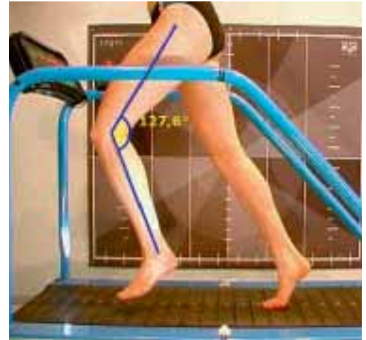
2 Aktives Anheben des Knies in der Schwungphase ist die Grundvoraussetzung für einen aktiven Laufstil.

Biomechanisch zwingt uns eine Überhöhung von Vor- zu Rückfuß – man spricht von der Sprengung des Schuhs – in eine Spitzfußstellung und unnatürliche Streckung im oberen