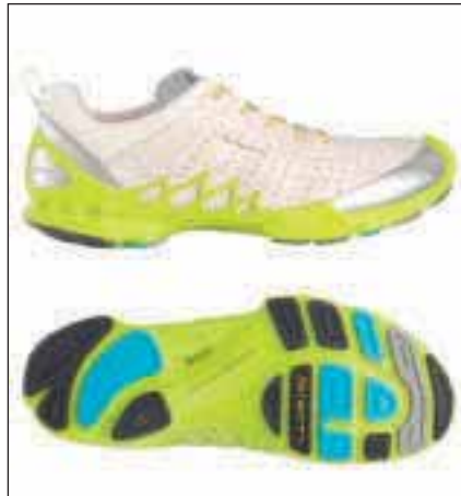
7 BIOM - Natural Motion von ECCO.

Meine Meinung: Der Nike Free ist die Mutter aller neuen Schuhkonzepte und so konsequent umgesetzt, dass es einfach nur Spaß macht, den Schuh zu tragen. Der Schuh hat in den Varianten 3.0 und 5.0 einen festen Platz in meinem Schuhschrank gefunden und überzeugt durch sein natürliches Laufgefühl. Auf die Frage, wer diesen Schuh laufen kann, antworte ich immer: Jeder, der in der Lage ist aktiv zu laufen. Für schwergewichtige, passive Läufer gilt: Stellt euren Laufstil um, verdient euch den Schuh – ansonsten Finger weg! Sicherlich ist der Schuh aber nichts für den ersten Marathon, sondern eher als Zweitschuh zu verstehen.